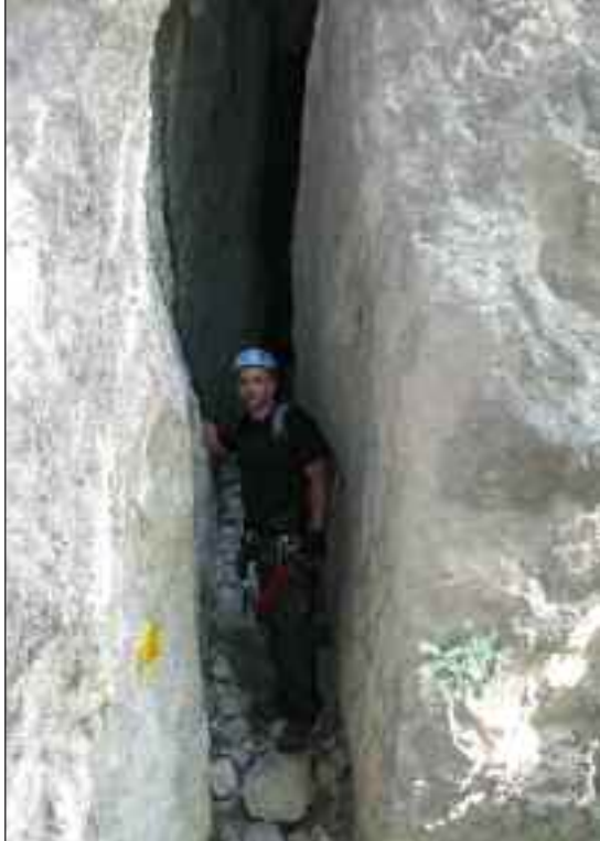
A bejárat. Már most izgalmas... ►

A Mein Land - Dein Land Klettersteig egy hallatlanul jól sikerült kis útvonal. A Berghotel Predigtstuhl parkolójából rögvest induljunk a kavicsos úton Rotmoss felé, majd mintegy 20 perc múlva forduljunk balra az Obermoossteigen a Predigtstuhl irányába. Körülbelül negyedórát cammogunk fölfelé, amikor elérünk egy „klettersteig balra” táblát. Ez az út a már fentebb említett Leadership-Klettersteighez vezet. Itt tehát tovább megyünk, majd úgy 50-60 méternyire elérjük a sziklafalat. A sziklafal előtt fordulunk jobbra egy jól követhető ösvényen. 5 perc múlva egy hasadékhoz érünk. Itt indul az útvonal.